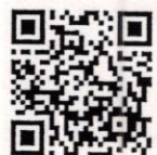
QR-Code เพื่อจองห้องพัก

โทรศัพท์: ๐๒-๔๒๒-๙๒๒๒ E-mail : rsvn@royalriverhotel.com