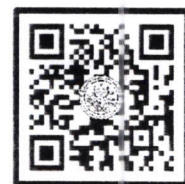
QR-Code ลงทะเบียนอบรม

สำนักงานบริการวิชาการ มหาวิทยาลัยศิลปากร (ตลิ่งชัน) โทรศัพท์ ๐-๒๑๐๕-๔๖๘๖ ต่อ ๑๐๐๒๖๖ , ๑๐๐๒๙๒