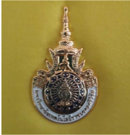
เข็มโลหะชุบทองลงยาที่หน้าปก